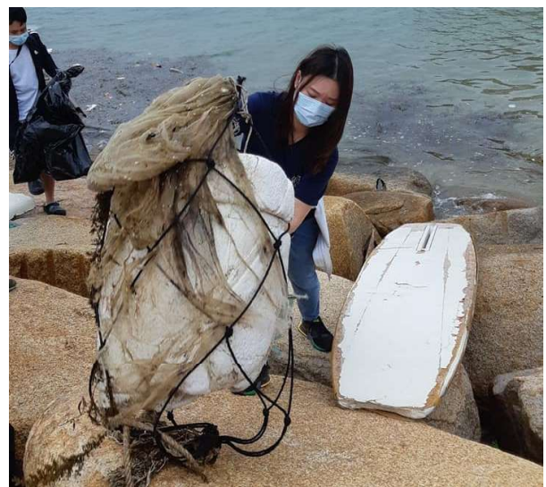
睿智環保科技團隊協助收集發泡膠廢物