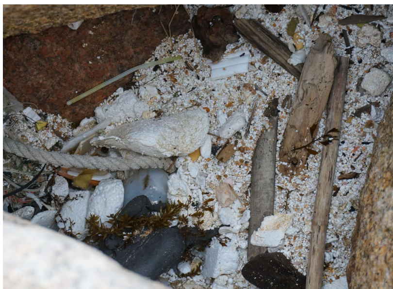
石縫間的發泡膠碎片

發泡膠廢物長期暴露於大自然環境下會慢慢碎化，變成碎片甚至微塑膠。我們的團隊看到了大量碎化了的發泡膠積聚於石縫間，完全不能伸手觸碰及收集，令海岸發泡膠廢物回收的難度大大提升。