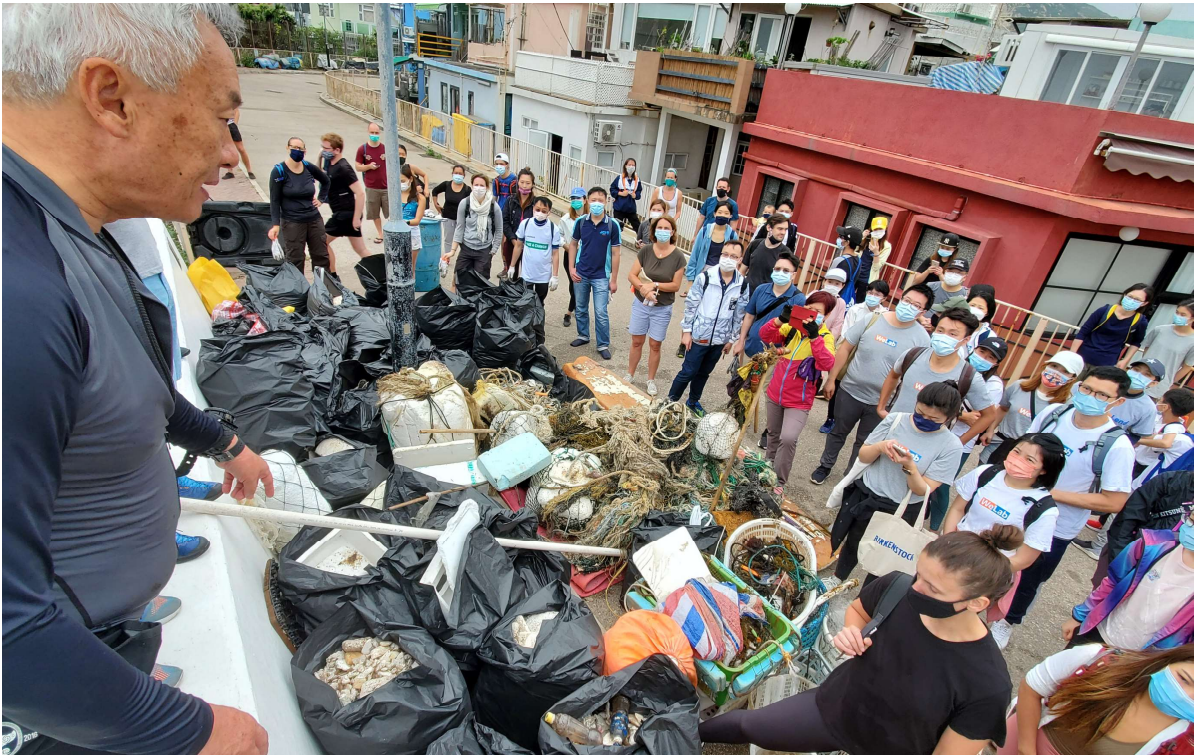
從海岸收集到各色各樣的海岸廢物

經過兩個小時的海岸廢物收集，我們將收集到的海岸廢物一併送到集合點並進行交流。海洋塑膠廢物大部來自陸地，發泡膠引起的白色污染逼在眉睫，我們希望香港政府能正視發泡膠污染問題，從源頭控制發泡膠棄置，並認真考慮推行發泡膠產品的生產者責任計劃，守護屬於大家的自然環境。