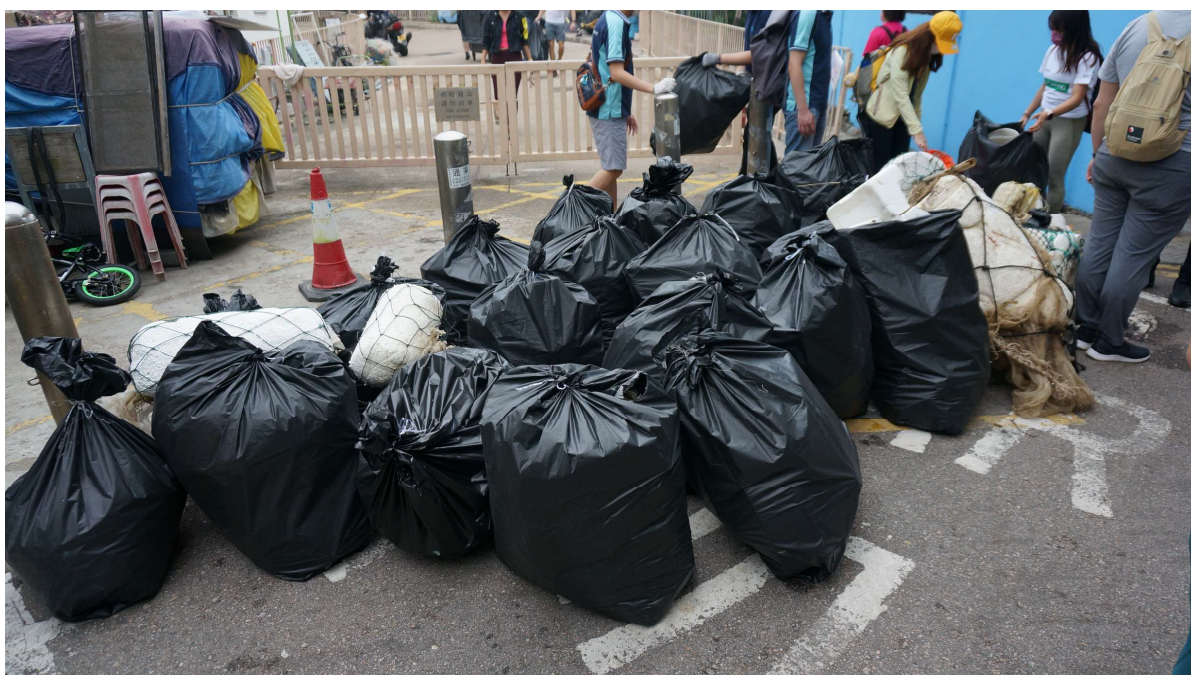
於石澳石灘收集到的發泡膠廢物（約八十公斤）