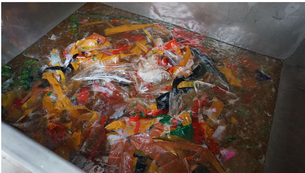
降解後發泡膠、膠紙及食物渣滓混合物

完成發泡膠廢物降解處理操作後，我們將發泡膠回收處理車駛回回收基地延續後續回收處理工作。我們先將發泡膠降解後的混合物中的雜質及異物進行過濾，然後再將混合物引入我們的淨化系統進行潔淨處理。