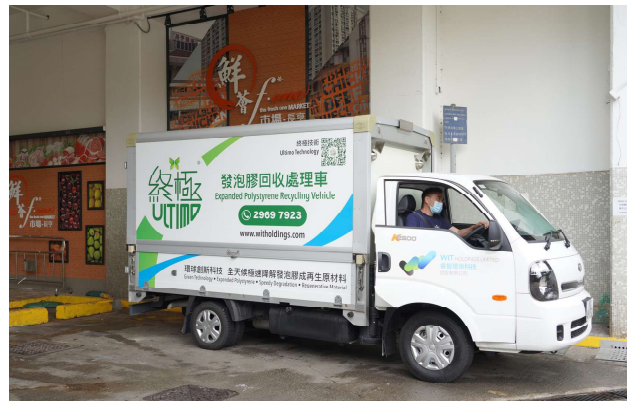
鮮薈市場·長亨（青衣）