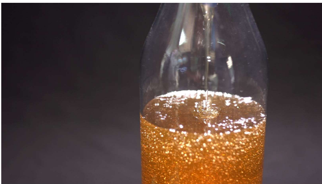
再生聚苯乙烯塑膠原材料

透過潔淨程序，終極降解溶液會被回收以供重複使用；而降解後的發泡膠亦會被提煉成再生聚苯乙烯塑膠原材料。