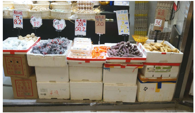
1. 以發泡膠箱堆砌成的食物展示台