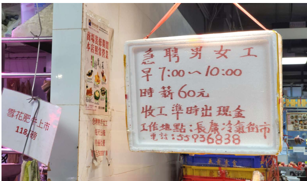
2. 發泡膠箱蓋製成的告示板