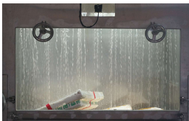
發泡膠投進降解缸進行處理