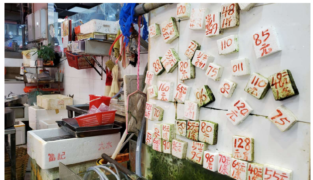
3. 發泡膠物料經裁剪後製作成的價格標籤

街市清潔工人會協助檔主收集廢棄的發泡膠箱並送往垃圾收集點暫存，直至收集商到場收走進行回收或棄置。