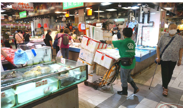
清潔工人收集發泡膠箱

街市清潔工人會協助檔主收集廢棄的發泡膠箱並送往垃圾收集點暫存，直至收集商到場收走進行回收或棄置。