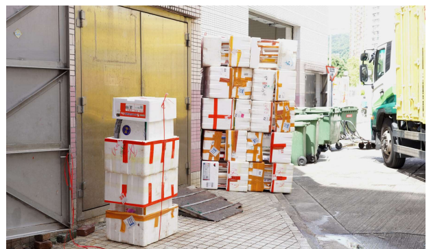
堆放於收集點的發泡膠箱