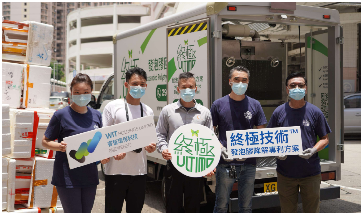
睿智環保科技與光亮實業代表於「鮮薈市場·雍盛」的合照

睿智環保科技控股有限公司於 2021 年 6 月與光亮實業有限公司達成合作回收街市廢棄發泡膠箱。我們的發泡膠回收處理車分別駛到其轄下位於粉嶺的「鮮薈市場·雍盛」和青衣的「鮮薈市場·長亨」提供現場發泡膠降解回收服務。