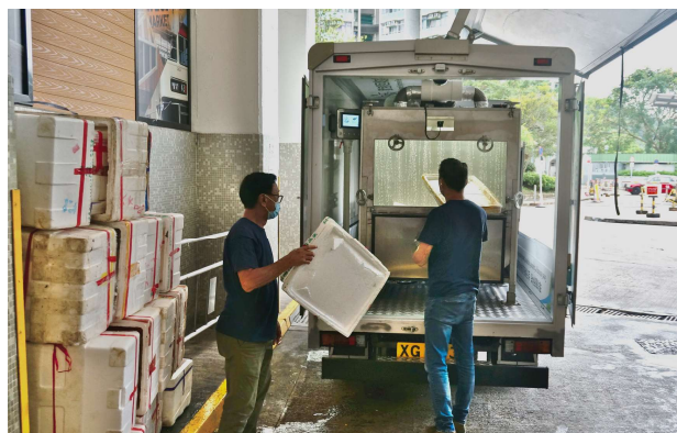
發泡膠箱被掉入流動發泡膠降解系統