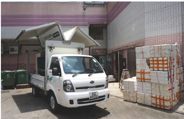
鮮薈市場·雍盛（粉嶺）